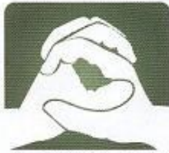
المبادرة الوطنية للتكافل الاجتماعي

وحث الجهات المختصة تجارياً داخل الأجهزة الحكومية على دفع الشركات من أجل أن تكون مسؤولة اجتماعياً، لما في ذلك من فائدة كبيرة ستعود على الشركة والمواطن وبشكل عادل، يكفل للمجتمع تحقيق النمو وبناء مستقبل أفضل للأجيال القادمة.