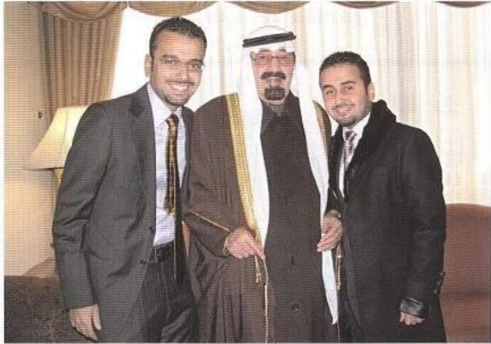
الملك عبدالله بن عبد العزيز مع أحفاده، فيصل وعبد العزيز بن خالد بن عبدالله

استبيان المبادرة الوطنية للتكافل الاجتماعي كشف أن السعوديات أقل تفاعلاً مع قضايا مجتمعهن، بماذا تفسرين ذلك؟ الحقيقة أن الأسباب ليست واضحة، فالاستثمارات